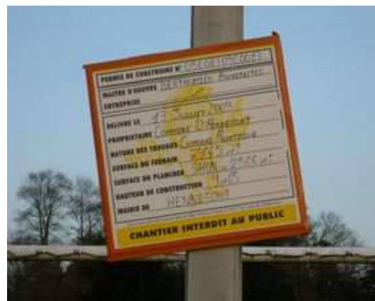
Le permis de construire est déjà affiché.