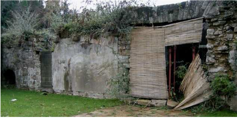
Pour masquer les étais qui tiennent les derniers vestiges de la Poterie, un simple store d'intérieur avait été installé en avril, lors de l'inauguration de la passerelle. Le cache-misère n'a évidemment pas résisté aux intempéries. Gwendal Henry